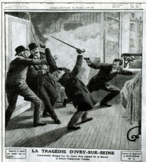
LA TRAGÉDIE D'IVRY-SUR-SEINE L'Anarchiste Bonnot au 11, Judo Club après le 24 Mars d'après l'original de Victor Méric

Ma chi erano questi «banditi tragici»? Il teorico era soprannominato Raymond-la-Science, tuttavia il nome vero era Raymond Callemain, amico d'infanzia di Kili'balchich a Bruxelles. C'erano poi il temibile Garnier, Valet, Carouy, il giovanissimo Soudy e una ventina d'altri, in-